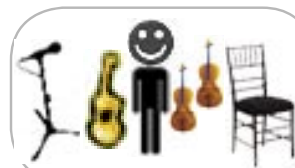
claudé méthé violons, guitare, voix

2 mics vocaux/vocal** (Shure SM58 ou équivalent) 1 mic percussion* (pieds/feet) 1 mic instrumental (accordéon/accordion) 4 boîtes directs/DI (2 violons/fiddles, 2 guitares/guitars) 2 lignes XLR, phantom/lines XLR, phantom 2 boîtes directs/DI (guitares/guitars) 2 retours de scène/monitors, 2 mixes 2 chaises, pas de bras/chairs, no arms