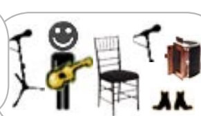
dana whittle guitare, voix, accordéon, pieds