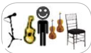
claudé méthé violons, guitare, voix