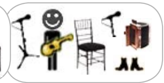
dana whittle guitare, voix, accordéon, pieds

5 mics vocaux/vocal** (Shure SM58 ou équivalent) 2 mics percussion* (pour pieds/for feet) 2 mic instrumental (accordéon/accordion; banjo) 3 lignes XLR, phantom/lines XLR, phantom (violons) 4 boîtes directs/DI (guitares/guitars; mandoline/mandolin) 2 retours de scène/monitors, 2 mixes 3 chaises, pas de bras/chairs, no arms