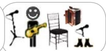
dana whittle guitare, voix, accordéon, pieds